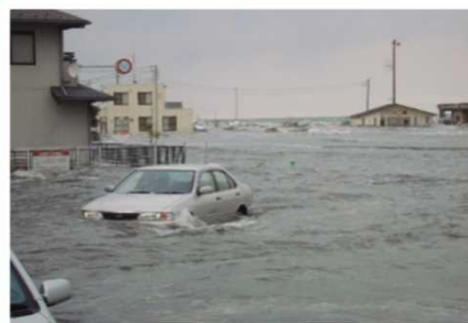
浸水した海水浴場（ひたちなか市）