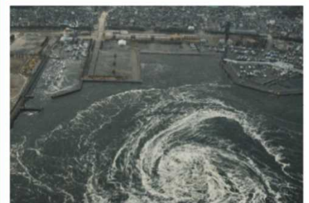
津波により発生した渦潮（大洗町）