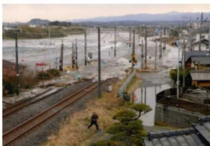
線路を越えた津波（北茨城市）