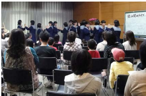
読み聞かせ会場の様子