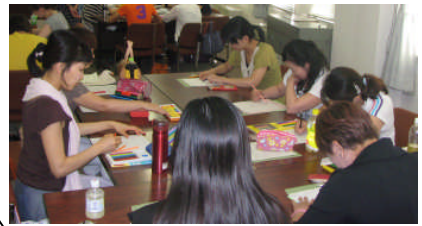
✂ 色彩セラピー体験中の様子

参加者の皆さんも、色彩を通して、今まで気付かなかった自分の現状を知り、マイナスの感情を発散することで新たな自分を発見できる気づきの多いセミナーとなりました。