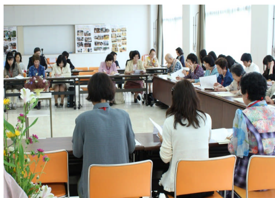
ボランティア全員協議会の様子

これからも、常に「自ら学ぶボランティア」という原点を忘れずに、地道に、こつこつと、草の根活動を進めていきたいと思っています。