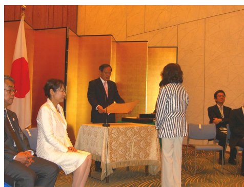
表彰式の様子（総理大臣官邸）

また、平成19年の発足以来現在まで、神栖市男女共同参画審議会の会長を務めるとともに、茨城県男女共同参画審議会委員として女性の能力活用や職域拡大に取り組むなど、男女共同参画の推進に尽力した功績が認められ受賞されました。