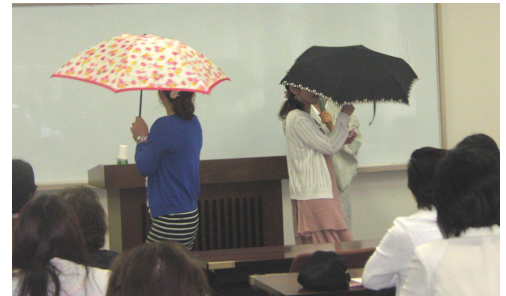
セミナー中の様子

マナーやしぐさは心を届ける手段として、多くの気づきをいただく大変貴重なセミナーとなりました。