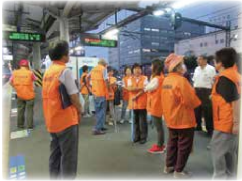
列車巡回のようす

も活動してまいります。心・安全な生活を願うことを長すること。健康やかに成長すること。は、青少年が楽しく過ごすこと。知識や各地区の現状を知ることに、本協議会の活動に生かされています。最後に私たち青少年が安心して過ごすこと。知識や各地区の現状を知ることに、本協議会の活動に生かされています。最後に私たち青少年が楽しく過ごすこと。知識や各地区の現状を知ることに、本協議会の活動に生かされています。最後に私たち青少年が安心して過ごすこと。