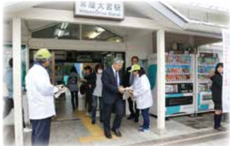
常陸大宮駅での挨拶運動