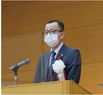
茨城県保健福祉部 関 福祉担当部長