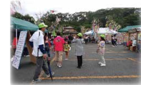
「七夕まつり in 緒川」での街頭相談