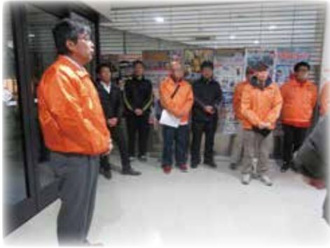
冬季巡回（交番にて）