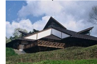
森のカルチャーセンター (県民の森内)