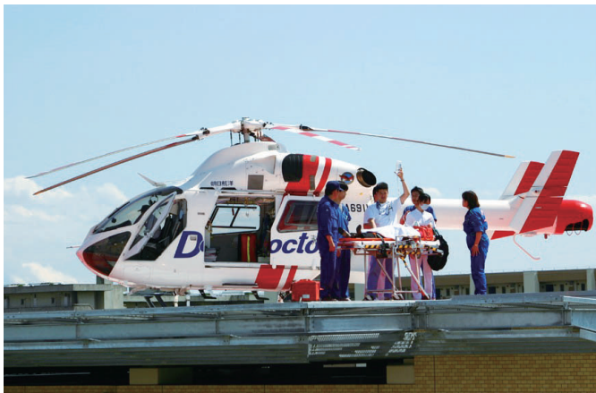
ドクターヘリ (イメージ写真)

○地域医療の充実・確保 本年七月から県内全域を約二十分程度でカバーするドクターヘリの運航を開始するとともに、休日夜間急患センターや救命救急センターの充実に取り組みます。また、五つの大学に寄附講座を設置し、医師不足地域等へ十六名の医師を派遣します。