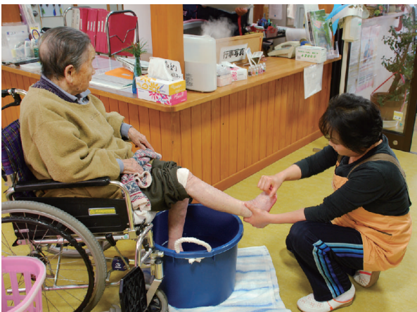
福祉・介護職員の確保を図ります

「第四期いばらき高齢者プラン21」に基づき、介護サービス基盤の充実や認知症対策の推進などに努めます。 また、研修・雇用一体型事業として福祉・介護職員確保特別対策事業を実施しますとともに、介護職員の処遇改善に努めます。