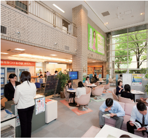
ジョブカフェいばらきでの就職相談