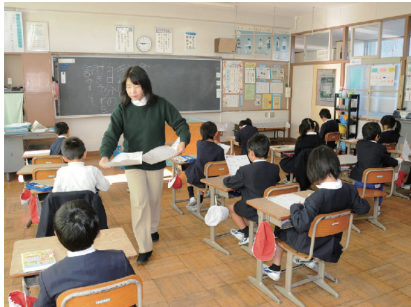
少人数教育の推進を図ります

本県が全国に先駆けて実施している少人数教育については、対象を現行の小学校一、二年から小学校三、四年にまで拡大し、基礎学力の定着・向上を図ります。さらに、中学校一年にも導入し、不登校等が増える、いわゆる中一ギャップ問題に適切に対応します。