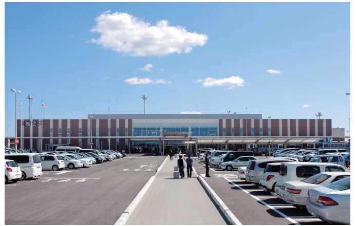
茨城空港の誘客促進に取り組みます

ともに、農業への新規参入者等が就農定着しやすいよう、農地や農業用機械・施設などのリースに加え技術アドバイスなど一体系化した実践農場をモデル的に整備します。 ○県北地域の振興 過疎地域の振興については、過疎地域自立促進特別措置法が六年間延長されたことを踏まえ、県内の過疎地域に居住する方々の日常生活の利便性の確保や地域づくりの促進のため、市町村が実施する事業に対して支援を行います。 また、県北地域の豊かな自然環境や地域の特性を活かし、体験交流を楽しむ「いばらきさとやま生活」のブランド化を図るため、首都圏などへのPRに努めます。特に、体験型教育旅行の