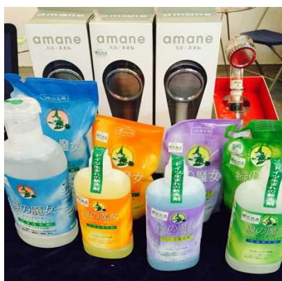
茨城県内企業関連製品の展示