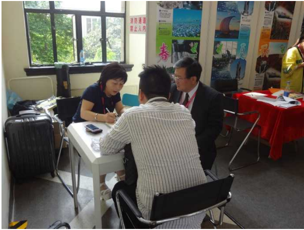
旅行関係者との面談の様子