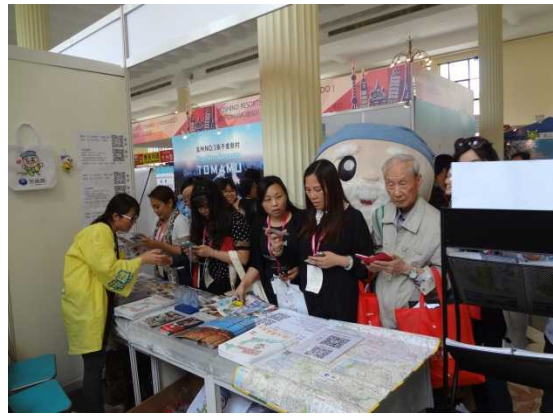
来場者が積極的に微博に書き込み