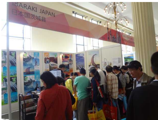
来場者でにぎわう茨城県ブース