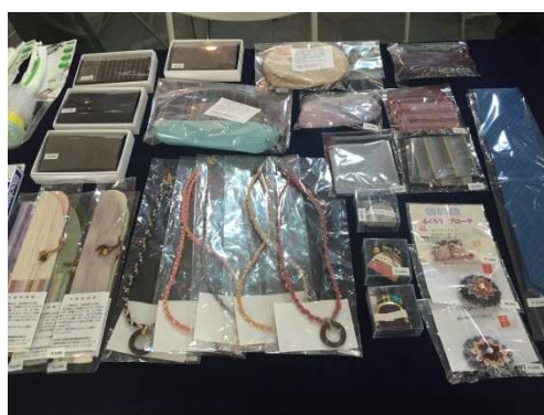
結城紬販売 大人気