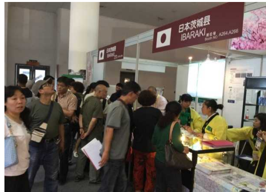
賑やかな茨城県ブース