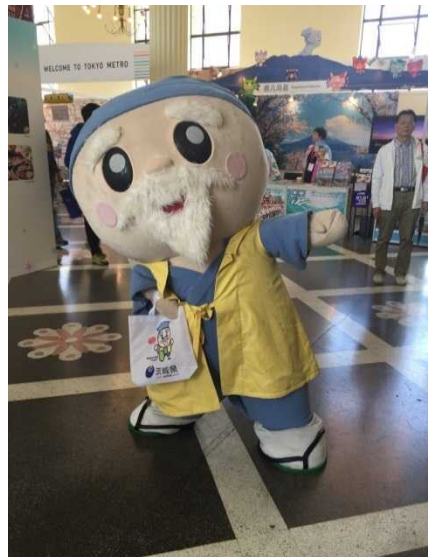
ハッスル黄門も登場