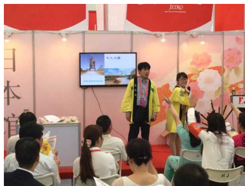
特設ステージでのプレゼンの様子