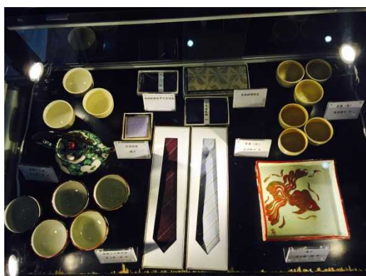
笠間焼・結城紬展示

http://www.sxdaily.com.cn/n/2015/0524/c145-5685675.html