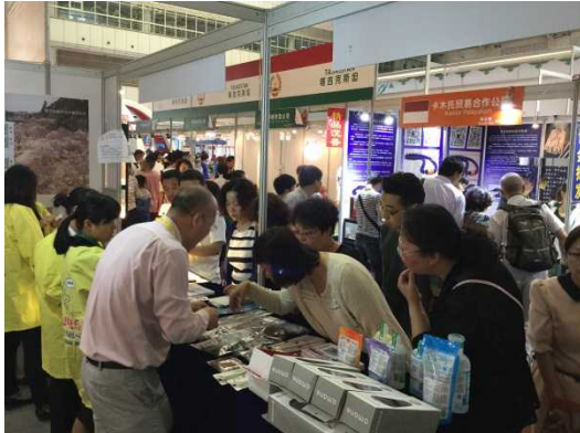
結城紬の購入を希望する来場者