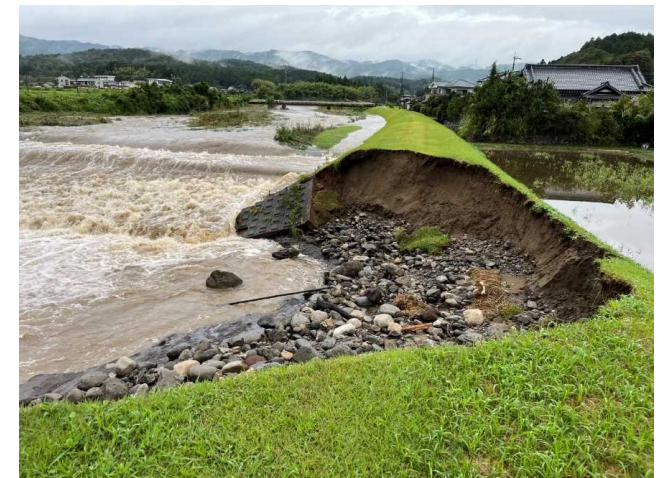
花園川(北茨城市華川町)