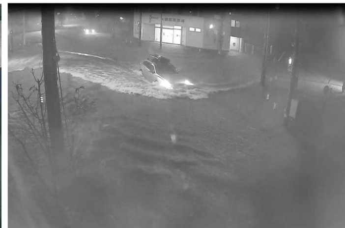
【北茨城市】磯原駅西側地区