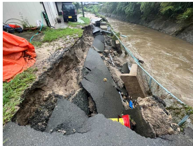
関根川(高萩市上手綱)