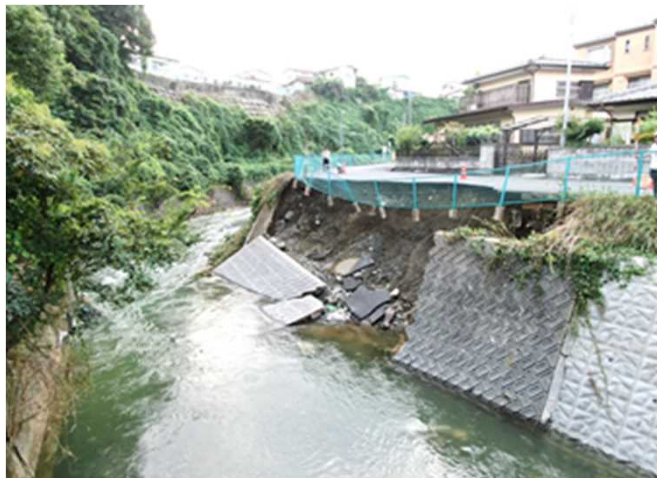
鮎川(日立市西成沢町)