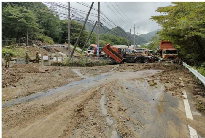
【日立市】県道日立山方線