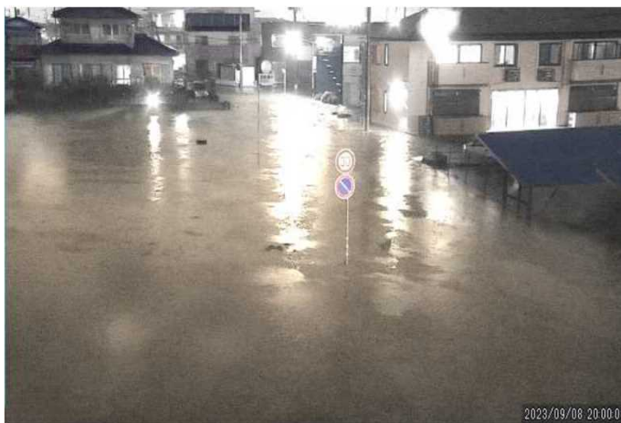
【高萩市】準用河川玉川沿川