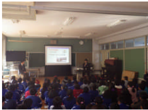
河川整備の必要性についてちょっと難しかったかな？ 【石岡市立南小学校】

政策審議室 Tel 029-301-2030 土木部企画室 Tel 029-301-4316