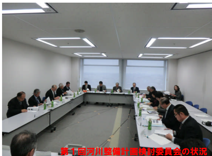
第1回河川整備計画検討委員会の状況

今後、皆様からのご質問やご意見を伺いながら編集してまいりたいと思っておりますので、ひきつづき河川かわら版をよろしく願っています。