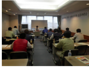
研修生のみなさんは、真剣な面持ちで受講されてました。 【秋山工務店】