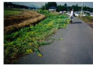
堤防の除草やゴミ拾いなどを行っています。