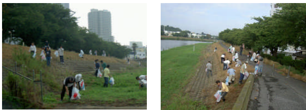
ゴミ拾いなどの清掃活動を行っています。