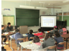
土木事業について、私たちの説明でわかったかな？ 【潮来市立大生原小学校】