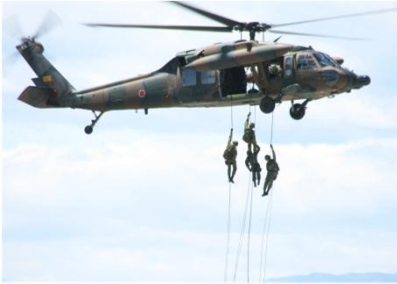
航空自衛隊による 防災航空隊員派遣訓練の様子