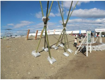
堤防の亀裂防止工法(五徳縫い工)

地元水防団・消防団による水防工法の訓練や、地元中学生による簡易水防訓練や避難訓練が行われました。また、陸上自衛隊などの防災関係機関による救出・救助訓練も行われました。再来年の第65回演習は、茨城県で開催いたしますので、ぜひご参加ください。