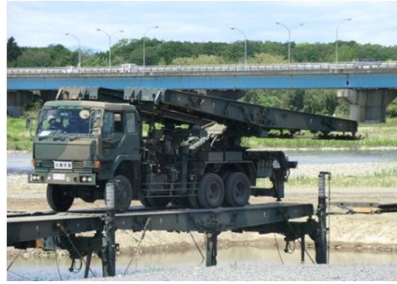
陸上自衛隊による 応急架橋整備訓練の様子