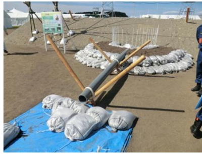
堤防の亀裂防止工法(釜段工)