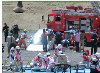
埋没車に取り残された 罹災者救出訓練の様子