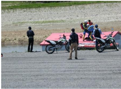
浸水家屋に取り残された 罹災者救出訓練の様子