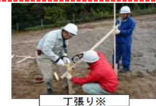
丁張り※ ※工事を着手する前に、盛土の高さ等を示す目印の杭を設置する作業