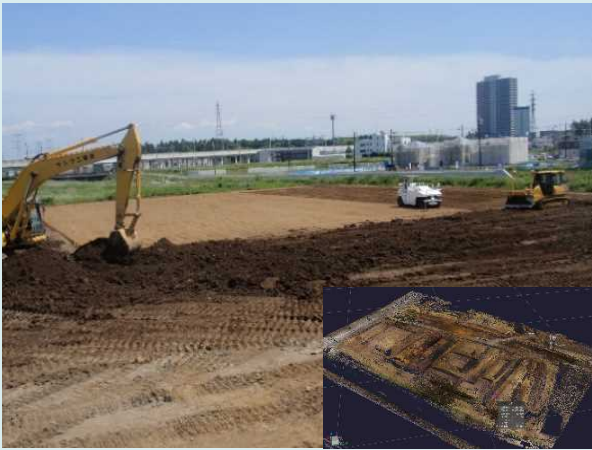
▲ICT活用モデル工事(土工)の発注 (H28年度3件, H29年度19件発注)