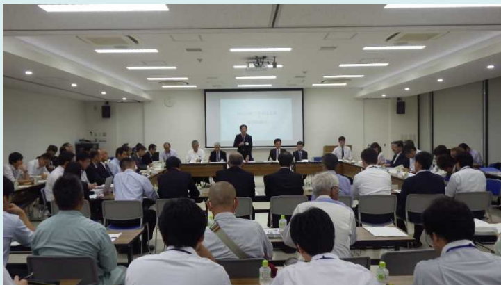
▲いばらきICT活用モデル工事支援協議会 (静岡県に次いで全国で2番目に設立し、モデル工事を支援)