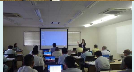
▲現場見学会・講習会の実施