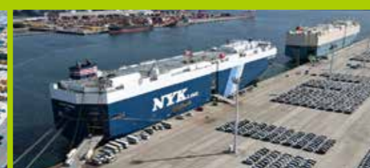
国内外RORO貨物の一大輸送拠点