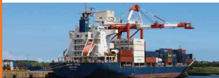
北公共埠頭におけるコンテナ荷役風景

鹿島港は鹿島開発を通して工業港として発展してきました。また、北公共埠頭には外航コンテナ航路や国際フィーダー航路が寄港し、南公共埠頭は、飼料等を取扱うなど商業港としても発展しており、今後さらなる港勢の拡大が見込まれます。