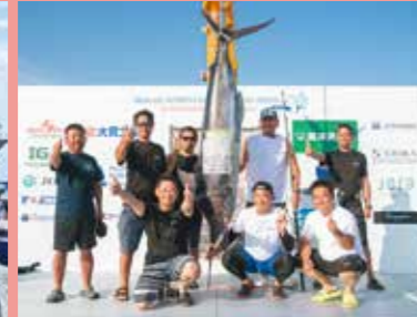
カジキ釣り国際大会