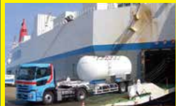
釧路から運ばれてくる貨物