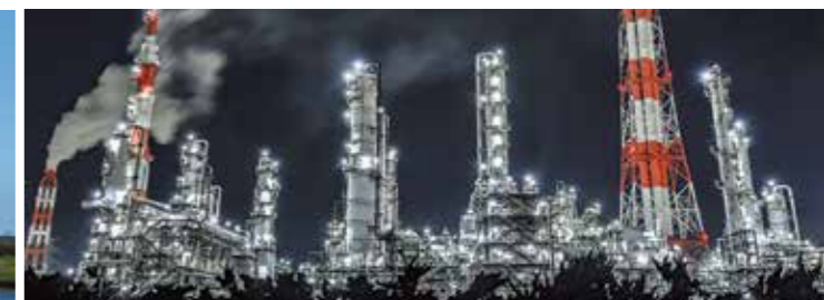
鹿島港の工場夜景