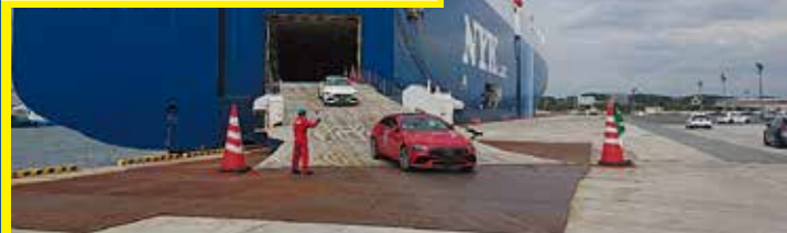
完成自動車の輸入