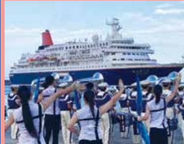
クルーズ船のお見送り