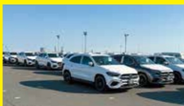
完成自動車の保管・搬出

様々な貨物を取扱う北関東の玄関口として発展し、現在では完成自動車(メルセデス・ベンツ、日産自動車)、石油製品、重油、LNG等を取扱っています。また、釧路定期RORO航路では大型RORO船がデイリー運航され、北海道の新鮮な生乳や農産物が県内をはじめ首都圏に迅速に運ばれています。