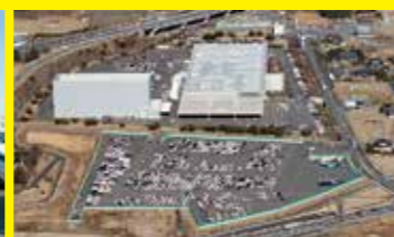
輸入車の新車整備センター