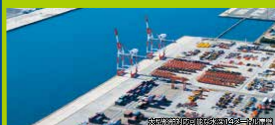
充実した港湾施設

国際海上コンテナターミナルを有する港湾として発展し、栃木県、群馬県を結ぶ北関東自動車道により、京浜港に一極集中している物資の流れを転換し、迅速かつ環境負荷の少ない物流を実現します。