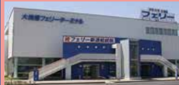
大洗港フェリーターミナル