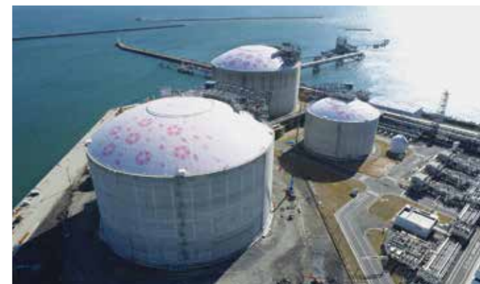
東京ガス(株)日立LNG基地