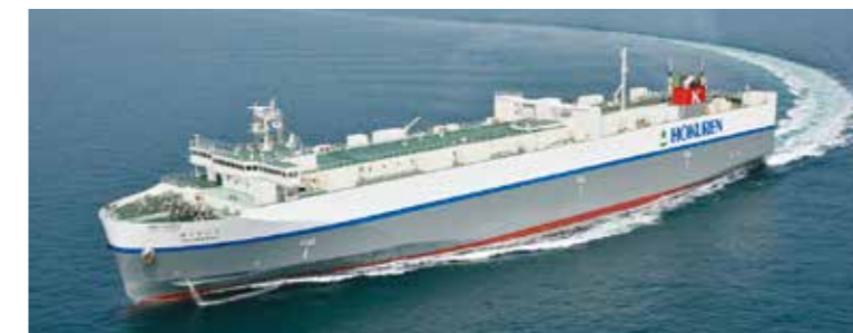
日立一釧路を結ぶRORO船「ほくれん丸」