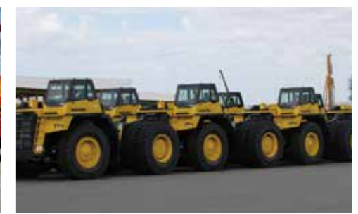
建設機械の荷役 (左:日立建機、右:コマツ)