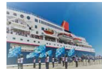
クルーズ船をお出迎え