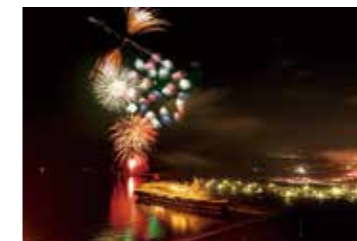
花火を臨むクルーズ船