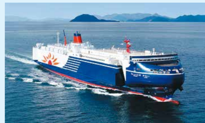
さんふらわあ かむい

・さんふらわあ さつぱろ(13,816G/T) 積載能力・・・トラック154台、乗用車146台、旅客定員590名 ・さんふらわあ ふらの(13,816G/T) 積載能力・・・トラック154台、乗用車146台、旅客定員590名 ・さんふらわあ かむい(15,512G/T) 積載能力・・・大型トラック155台、乗用車50台、旅客定員157名 ・さんふらわあ ぴりか(15,512G/T) 積載能力・・・大型トラック155台、乗用車50台、旅客定員157名