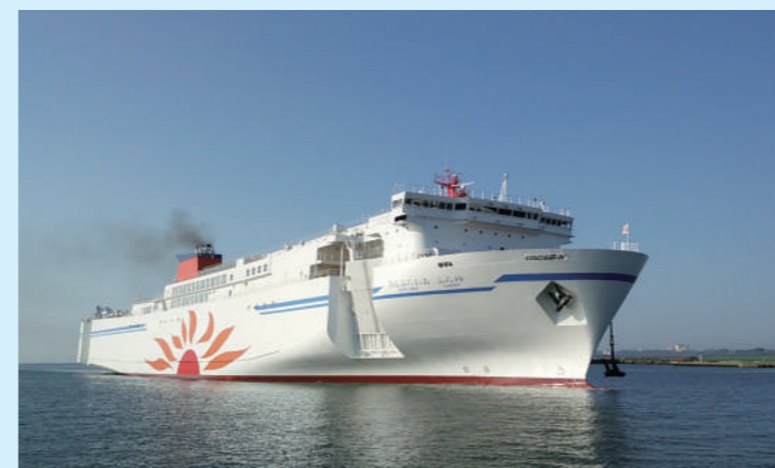
さんふらわあ ふらの

○運航船社・集荷 ・近海郵船(株)東京支店 〒105-0012 港区芝大門1-9-9 (野村不動産芝大門ビル7階) TEL:03-5405-8290 FAX:03-5405-8288 ・近海郵船(株)常陸那珂営業所 〒319-1113 那珂郡東海村照沼字渚768-61 TEL:029-264-2700 FAX:029-264-2701 ・川崎近海汽船(株)内航定期船部 〒100-0013 千代田区霞が関三丁目2番1号 TEL:050-3821-1392 FAX:03-3592-5914 ・川崎近海汽船(株)日立支店 〒319-1113 那珂郡東海村照沼768番46号 (日立埠頭(株)常陸那珂事務所2階) TEL:050-3821-1495 FAX:029-200-4015 ○配船船舶 ほっかいどう丸(12,265G/T) 北王丸(11,492G/T) まりも(11,229G/T) ましう(11,229G/T)