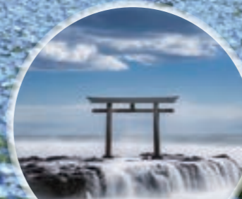
神磯の鳥居 (大洗磯前神社)