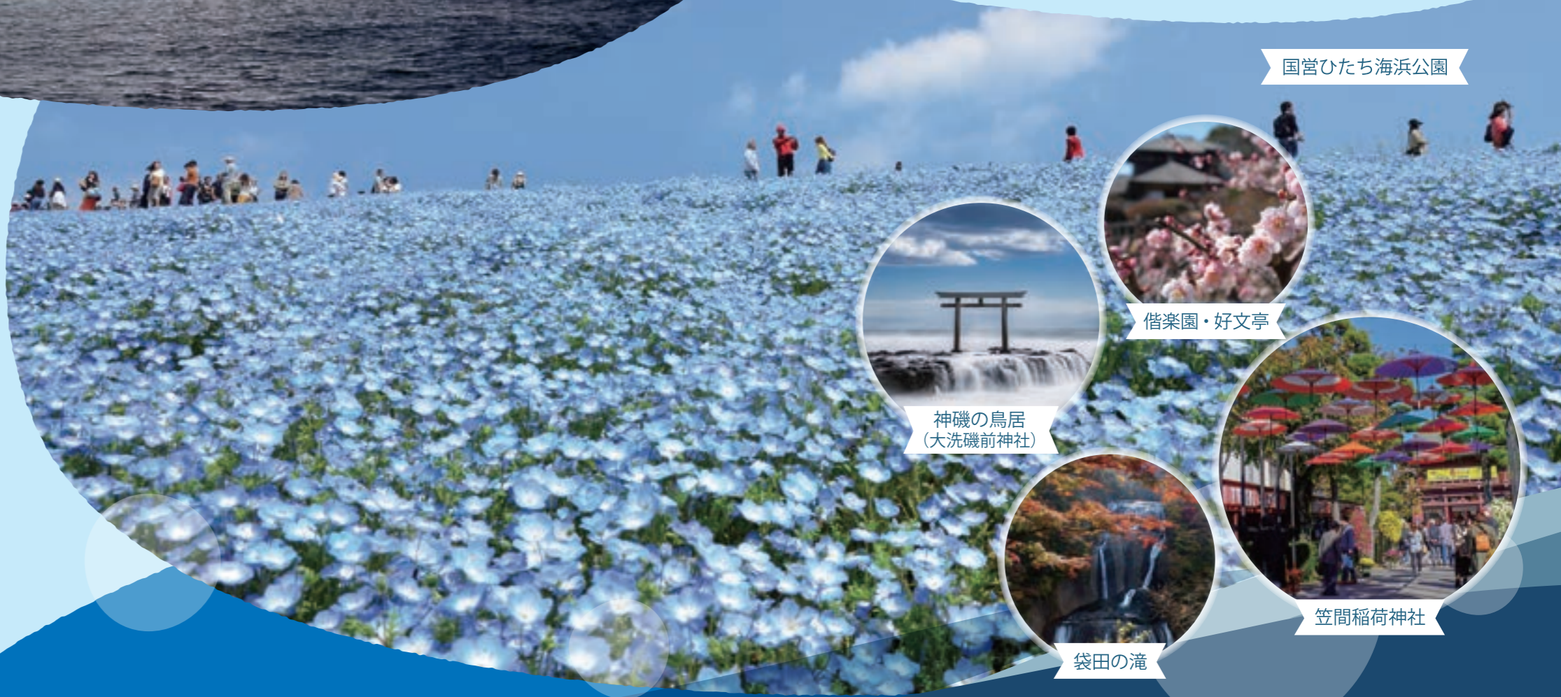
国営ひたち海浜公園