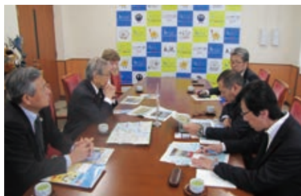
小谷大洗町長への表敬訪問