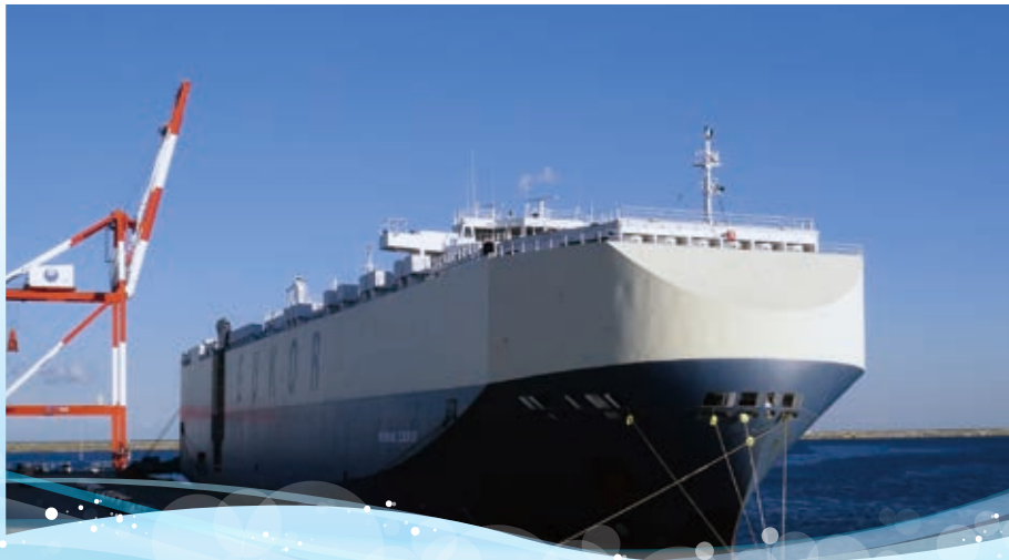
常陸那珂港区に入港した「EUKOR CAR CARRIERS」のRORO船