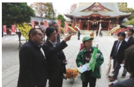
笠間稲荷神社を視察