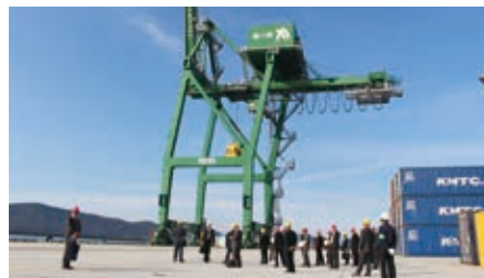
コンテナターミナルを視察