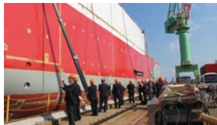
船舶建造の現場を視察