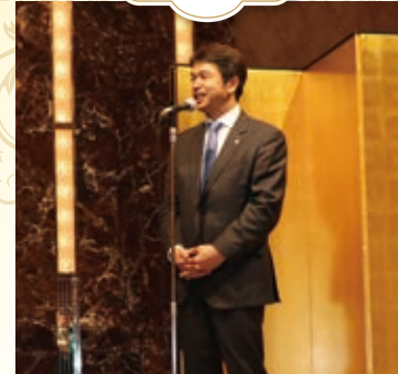
主催者挨拶(大井川知事)