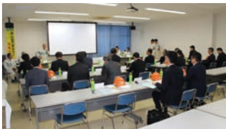
最新の造船技術の説明