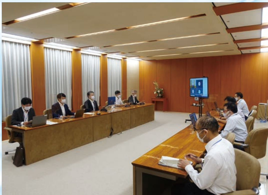
第2回 WEB 会議の様子(9月2日開催)

当会議は、臨海部立地企業、行政団体などで構成されており、茨城港・鹿島港において、水素・アンモニア等の次世代エネルギー利活用の需要と供給を一体的に創出するとともに、港湾機能の高度化や臨海部における環境に配慮した産業の集積を図る「カーボンニュートラルポート」形成に向けた検討を行うことを目的に開催されています。今後、企業等のカーボンニュートラルの取組内容のヒアリングなどを行いながら、今年度中にカーボンニュートラルポート形成計画案を取りまとめていく予定としています。