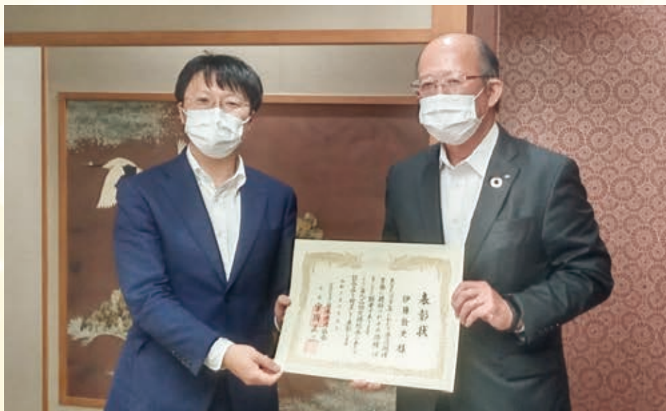
左：青山港湾振興監 右：伊藤社長

今年度は、新型コロナウイルスの感染拡大により授賞式開催が難しい状況であったため、茨城県港湾協会事務局から受賞者に表彰状と副賞を贈呈しました。