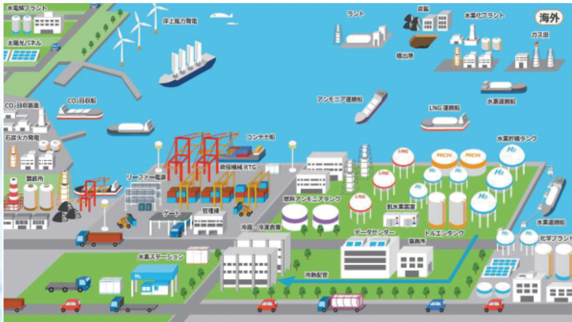
カーボンニュートラルポート形成イメージ