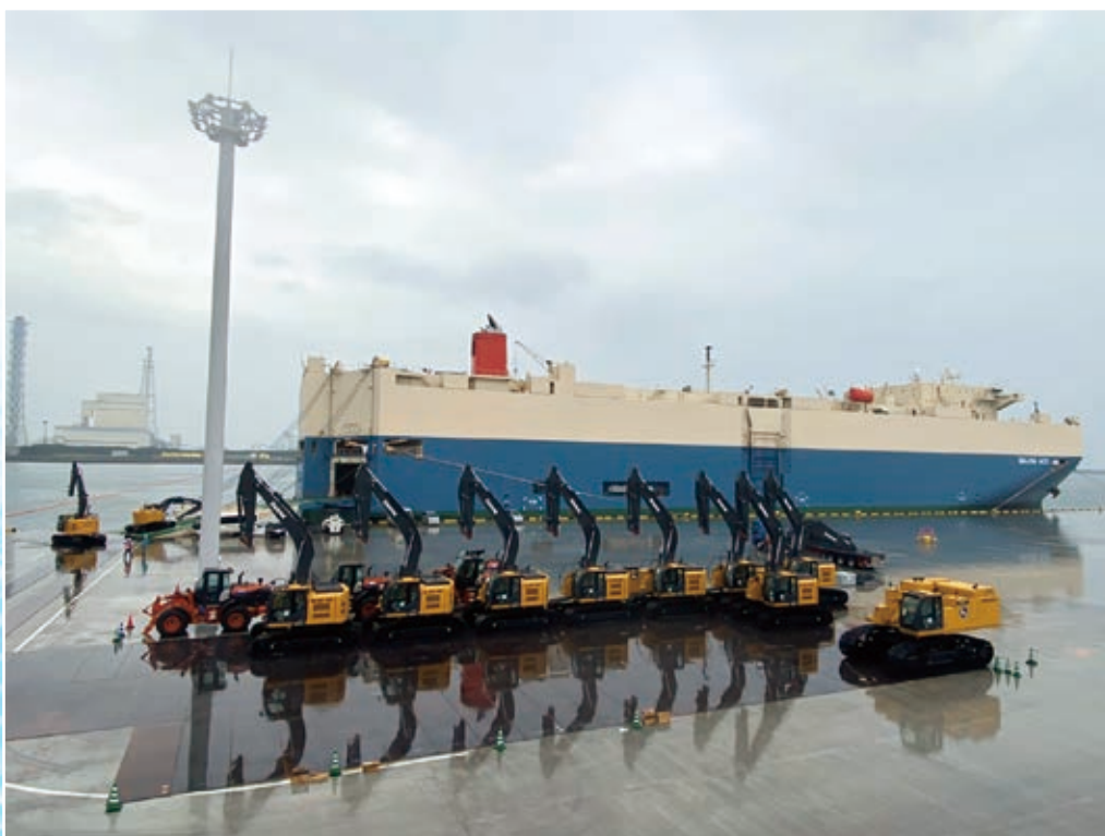
建設機械を積載する様子

D岸壁の供用開始によって、中央ふ頭地区は大型RORO船2隻の同時接岸が可能になり、利便性が向上したことで、中央ふ頭地区のさらなる利用拡大が期待されます。