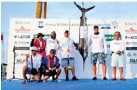
カジキ検量式の様子

悪天候により28日(日)は大会・イベントともに中止となりましたが、大会には34隻、約200人が参加し、計6本のカジキが釣り上げられ、イベントには県内外から約3,000人が訪れました。