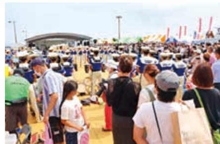
イベント会場の様子