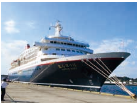
入港した「にっぽん丸」

出港の際は、大洗高校ブルーホークスによるダイナミックで華麗なドリル演奏とともに、お子様からご年配の方まで多くの人々が、手旗を振ってにっぽん丸の出港を見送る中、大きな船体をゆったりと進めて夏を満喫するクルーズへと出港していきました。