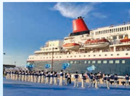
大洗高校ブルーホークスによるお見送り演奏