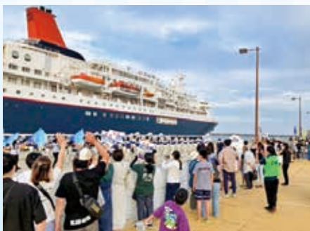
手旗を振ってお見送り