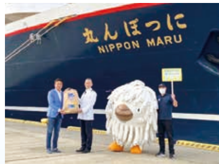
國井豊大洗町長による記念品の贈呈