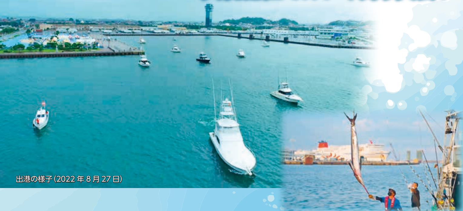
出港の様子(2022年8月27日)