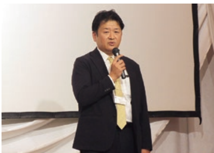
針谷港湾振興監 主催者挨拶

企業講演の合間には「ティーブレークタイム」を設け、活発な情報交換等が行われました。