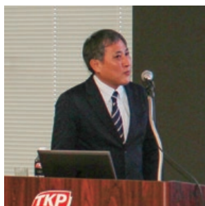
OOCL 更科 様