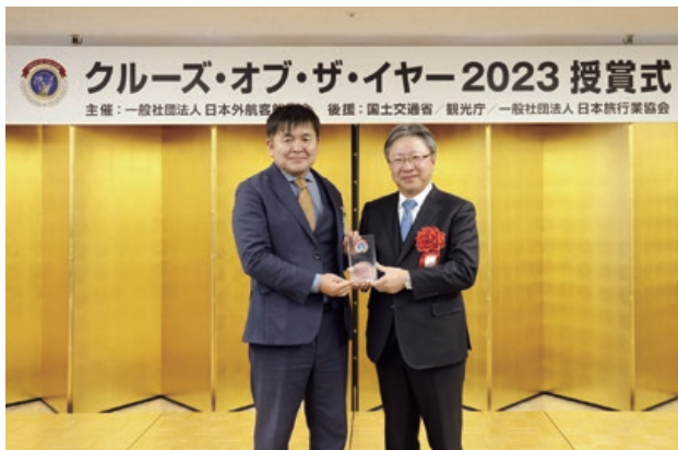
授賞式 (日立埠頭の家次社長(右)と寺門室長)

「東日本地域のクルーズ需要の拡大」「船内では地元・大洗町の特産品を提供するなど地元活性化」に貢献したことが評価されての初受賞となりました。