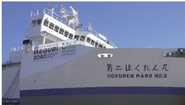
MEGURI2040の横断幕が掲示された第二ほくれん丸

今後、無人運航技術の向上により、海上運航の安全性の向上や船員の労務負担軽減につながることが期待されます。