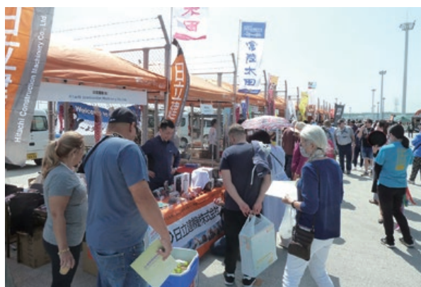
歓迎イベントの様子