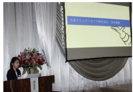
日本ミシュランタイヤ(株) 中軽米 様