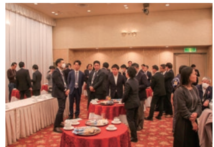
ティーブレークタイムの様子