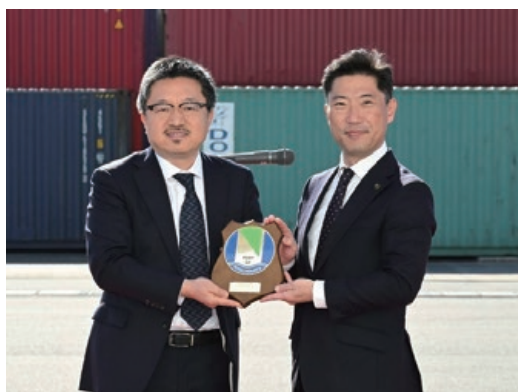
大谷会長から張代表取締役社長(左)への記念盾贈呈

本航路開設により、常陸那珂港区における中国・韓国方面の定期コンテナ航路は週3便から週4便になりました。アジア圏との輸出入の利便性がさらに向上し、常陸那珂港区の利用が一層促進されることが期待されます。