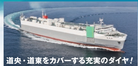
道央・道東をカバーする充実のダイヤ!

ほくれん丸 / 第二ほくれん丸 日立 14:00入港 - 18:00出港 / 釧路 14:00入港 - 18:00出港