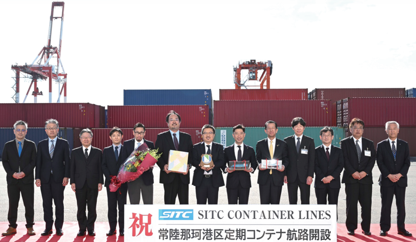
常陸那珂港区定期コンテナ航路開設歓迎セレモニー（令和6年2月1日）