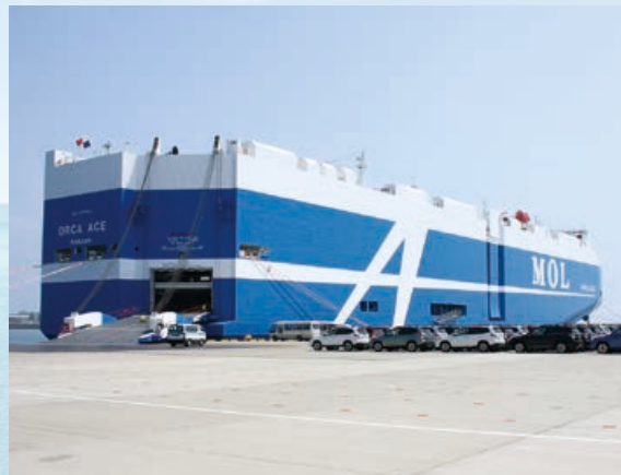
完成自動車の荷役作業