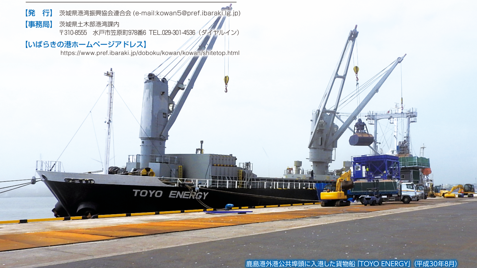
鹿島港外港公共埠頭に入港した貨物船「TOYO ENERGY」(平成30年8月)

https://www.pref.ibaraki.jp/doboku/kowan/kowan/shitetop.html