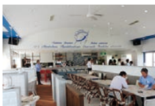
白を基調とした店内

ランチ 11:00~15:00 (土日祝~17:00) ディナー 18:00~22:00 ※オーダーストップ 21:30 (水曜定休)