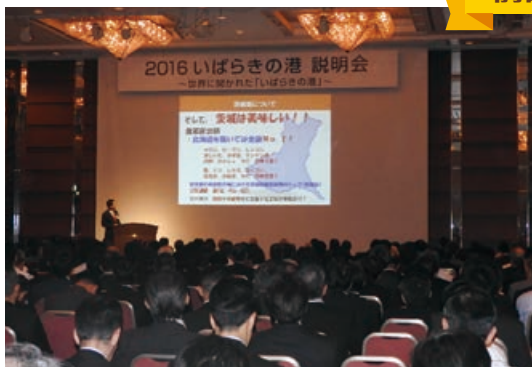
第1部「説明会」の様子