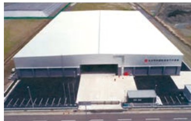
新設された指定可燃物倉庫