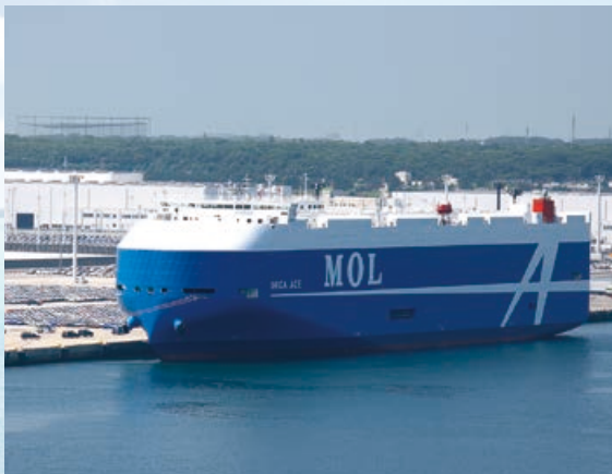
次世代型自動車船「ORCA ACE」

常陸那珂港区では、完成自動車の輸出が順調であり、今後も更なる発展が期待されています。