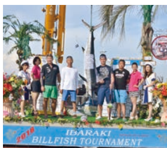
検量後の記念撮影

8月25日(土)、26日(日)の2日間にわたり、いばらきビルフィッシュトーナメントネットワーク主催による「茨城ビルフィッシュトーナメント」が大洗港区で開催され北は宮城県、南は兵庫県から42隻の参加がありました。