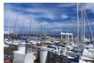
潮風を感じる開放的なテラス