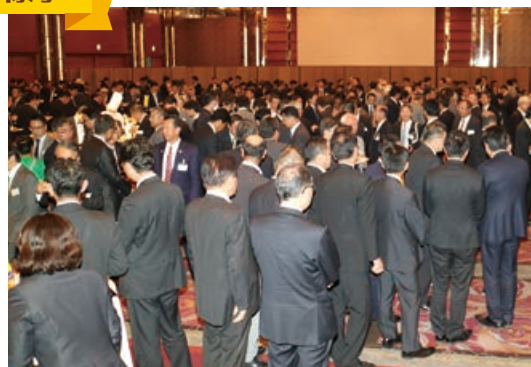
第2部「交流会」の様子