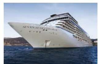
セブンシーズ エクスプローラー