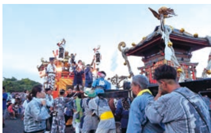
神輿渡御と山車巡行

会場では、毎年恒例の山車巡行や神輿渡御、日立太鼓連盟の演技が披露されました。また、夜には花火大会が開催され、約2,000発の花火が、集まった大勢の人々を魅了しました。