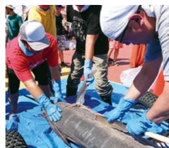
カジキの解体ショー

参加者が釣り上げた、50キロを超えるカジキがクレーンで吊り上げられると、会場は歓声に包まれました。また、同時開催された大洗まつり実行委員会主催の「大洗海の感謝祭2018」では、約3千人の来場者を迎え、カジキの解体ショーやカジキ料理の提供などが行われました。