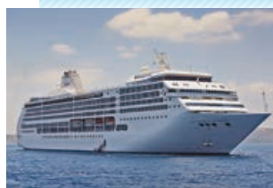
セブンシーズ マリナー