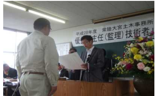
【桑田所長より賞状の授与】