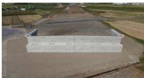
「土木部長表彰」 橋梁下部工事 仮称下大賀高架橋 一般国道118号 増子建設(株)