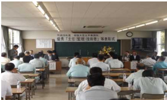
【表彰式会場・出席者】