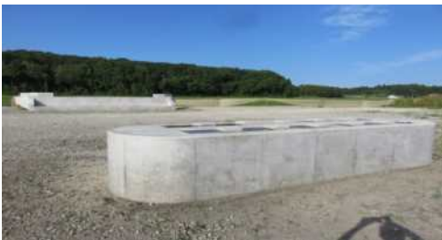
「知事表彰」 橋梁下部工事 道栄橋 1級河川 中丸川 (株)大曾根建設

平成27年度内に完了した県発注工事で、常陸大宮土木事務所からは、知事表彰1件、土木部長表彰1件が受賞されました。