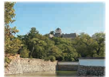
丸亀城天守を臨む