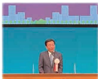
大西秀人 高松市長