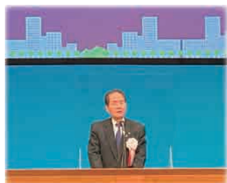
浜田恵造 香川県知事