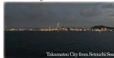
Takamatsu City from Setouchi Sea