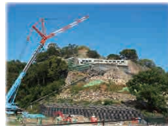
復旧工事中の石垣

丸亀城跡は、丸亀市の中心市街地に位置する亀山に築かれた平山城で、江戸時代に再築された石垣は、美しい勾配をもつ高石垣の名城として全国的に有名である。平成30年7月豪雨及び10月の台風25号により帯曲輪石垣、三の丸坤櫓跡石垣が崩落し、令和5年度末の復旧を目指し、復旧工事を実施している。