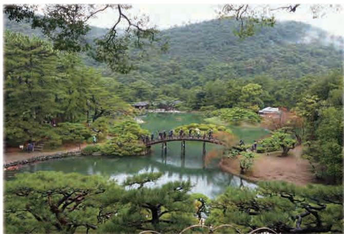
飛来峰より月橋を臨む

偕楽園・後楽園・兼六園と並ぶ文化財庭園。四百年近い歴史を誇る江戸初期の回遊式大名庭園として、すぐれた地割り、石組みを有し、黙隻の雅趣に富んでいる。