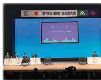
ディスカッション 「コンパクトなまちづくりの課題」

特に、線引きを廃止した高松市において、新駅創設などの交通施策や立地適正化計画などの活用により市街地への回帰が起きていることは注目すべきことだと感じました。両市とも、将来の都市構造を考えるにあたって、人口構成や産業分布、通勤、通学や商圈など、都市における人の行動や趣向に着目し、都市構造やまちづくりを考えていると感じました。