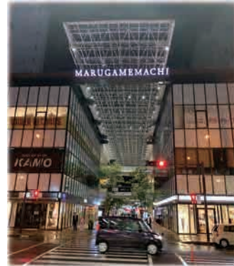
丸亀町グリーン (正面ゲート)

高松市の中心部に位置し、高松城の城下町として古くから栄えてきた商店街だが、モータリゼーションの進展や市民ニーズの変化などにより、年々衰退しつつあった。車に依存しない・歩いて事足る商店街を目指し、平成2年よりA～Gの7街区に分け再開発計画を策定、定期借地権などの制度を活用し、事業を進めている。