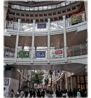
舌番街前ドーム広場