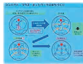
高松市 プレゼンスライド