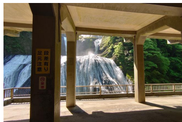
第1観瀑台からの滝