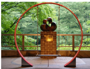
恋人の聖地モニュメント