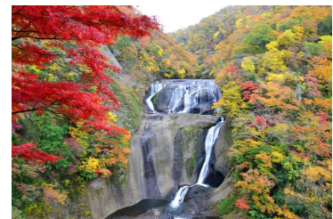
第2観瀑台からの滝