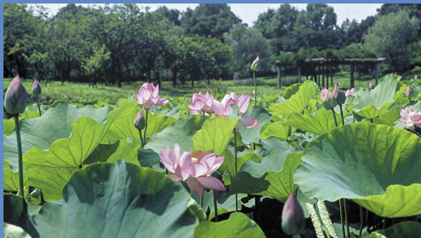
古河総合公園の大賀ハス (古河市)