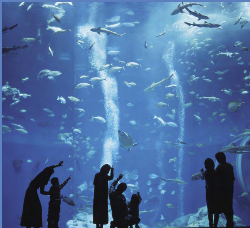
アクアワールド大洗 (大洗町)

海、滝、湖…茨城県内には夏の観光資源が数多くあります。 今年の夏は、“いばらきの魅力”を満喫してみませんか？