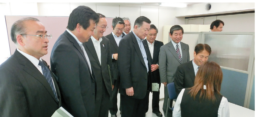
結婚支援の取り組みについて説明を受ける委員

県の結婚支援事業の概要や、センターへの会員登録及び成婚数の状況などについて説明を受け、センターの運営などに関する活発な質疑が行われた後、施設において、会員の検索の仕方などを調査しました。