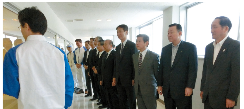
乳製品工場の工程について説明を受ける委員

乳製品などを製造している同工場において、高度な衛生管理状況や各製品の製造工程について説明を受けた後、実際に製品を製造している工程を調査しました。