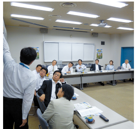
県自然博物館の環境保全活動について説明を受ける委員

また、県自然博物館が地域の里山活動団体、研究機関などと協力して実施している絶滅危惧種タチスミレを守る取り組みについて説明を受けました。