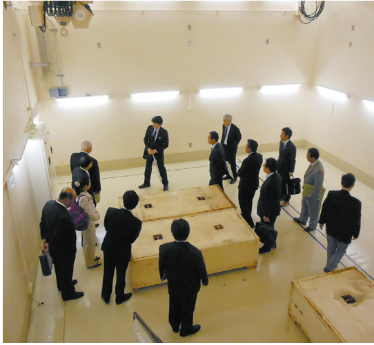
整備中のBNCTの設備を調査する委員

BNCTなどの概要、今後の予定・展望について説明を受けるとともに、現在整備中の施設も調査しました。