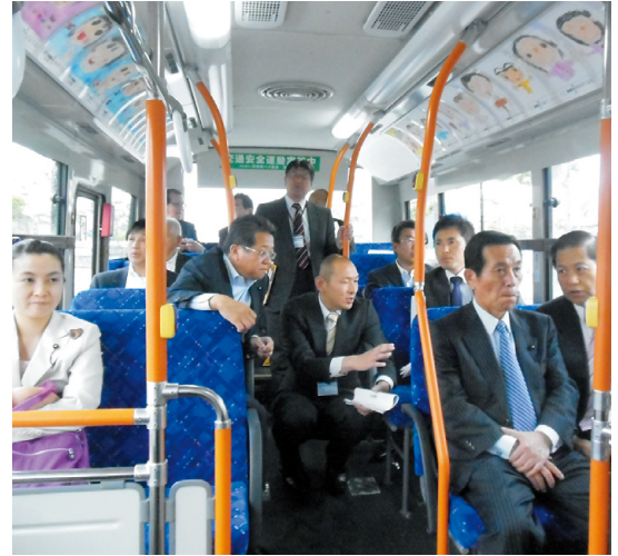
「ひたちBRT」に乗車する委員