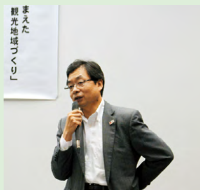
川瀧観光地域振興課長による講演会の様子

ではなく、来訪者が地域を回遊し、滞在時間を増やす取り組みや地域を愛する人たちと来訪者がふれあうことでリピーターを確保する取り組みが不可欠」などの観光地域づくりにつながる貴重な講話をいただきました。