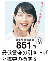
最低賃金の引き上げと遵守

議員 地域実態に沿った最低賃金の引き上げが必要である。また、遵守されるよう厳しく監督し、違法事業所の摘発や罰則適用の強化など制度の実効性を高めることも重要となるが、どう取り組むのか。 産業戦略部長 近隣県との格差もあり、最低賃金引き上げの働き掛けを継続する。いばらき就職支援センターで事業者に対する最低賃金の遵守徹底や、違反の恐れのある情報収集に積極的に取り組む。 (ほかに、那珂川における総合的な河川災害への対応、ひたちなか大洗リゾーツ構想の現状と今後の展開なども質問)