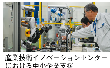
産業技術イノベーションセンターにおける中小企業支援

議員 県内中小企業が、業務の拡大や新分野への進出などにより、企業規模を拡大し、稼げる企業に成長することが重要である。地域を牽引していきけるような中小企業をどのように育成していくのか。 産業戦略部長 事業者によるM&Aや事業再生支援を強化するとともに、国や商工団体などの連携も強化し、生産性の向上や中小企業の中堅化を促進していく。 (ほかに、経済再生と脱炭素社会の推進、ICTを活用した教育の可能性なども質問)