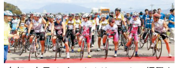
鬼怒・小貝リバーサイドルートの振興を(鬼怒川サイクルフェスタ2019の様子)

議員 八千代町の山川沼地区における九郎兵衛橋付近の排水問題について、取り組みの方向性は。 農林水産部長 九郎兵衛橋の改修計画を見直し、必要な排水が支障なく行われる構造に改めるとともに、九郎兵衛橋などの改修と並行して、残る排水ポンプ一台も設置していく。これらの改修の際には、地元の農業者や住民に十分理解いただけるよう丁寧に説明していく。 (ほかに、5G ※1 時代を見据えた産業振興と環境整備、有害使用済機器 ※2 の適正な処理なども質問)