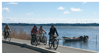
涸沼湖畔のサイクリングの様子

議員 コロナ禍で花の消費は激減し、花き生産者の経営は厳しい状況にある。今後どのように本県の花きを振興していくのか。 農林水産部長 低コストで栽培できる新たな品目導入に向けた栽培指導や、ネット販売などに取り組む生産者を対象とした商品設計を学ぶ研修会の開催など、生産、販売面の支援を行うほか、若い世代への花の消費拡大にも努めていく。 (ほかに、農業由来の廃プラスチックのリサイクルと排出抑制、涸沼川沿川の洪水対策なども質問)