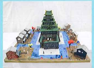
昨年度の入賞作品です