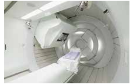
※陽子線治療 (筑波大学附属病院)