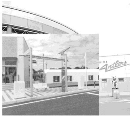
鹿島アントラーズクラブハウス

【 歩数：10,200歩 消費カロリー：男性約322kcal、女性約267kcal 】