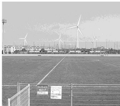
練習グラウンドと風車