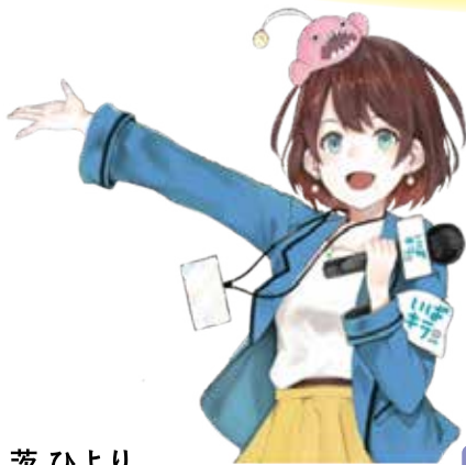
茨ひより (茨城県公認Vtuber)