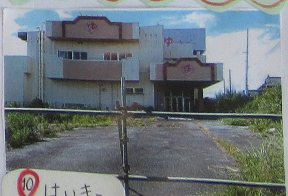
⑩ はいきよ さくが すくはいからさく