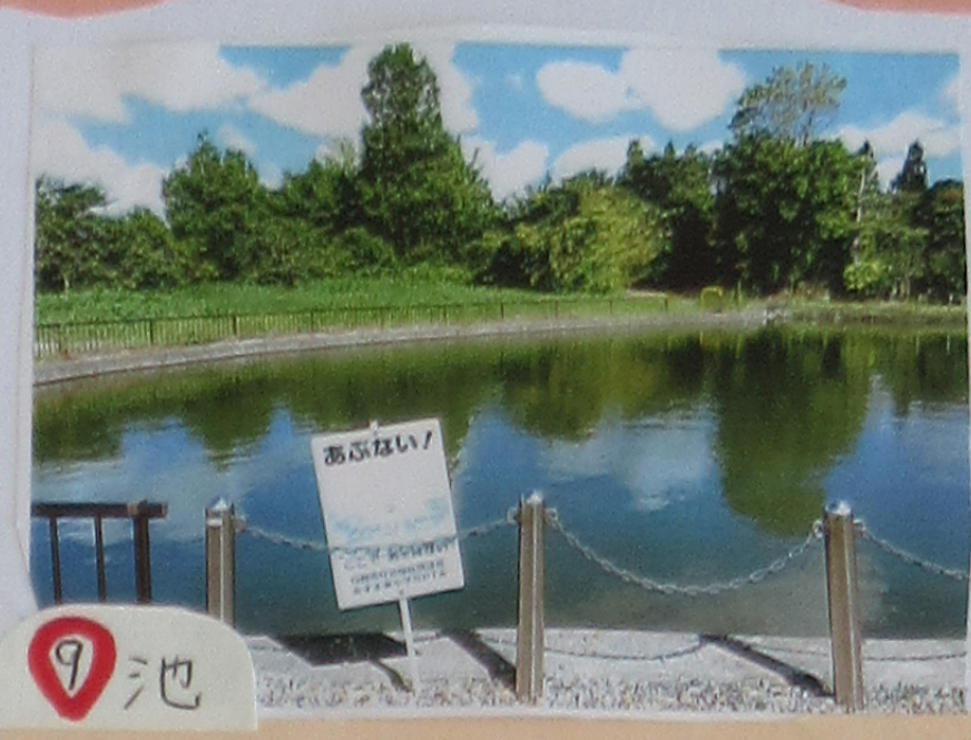
⑨ 池 このちかくでさく 水のじょうちから