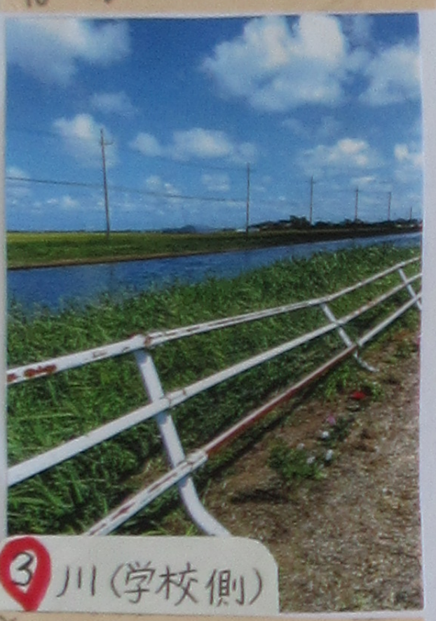
③ 川(学校側) さくが すくはいからさく すくはいからさく