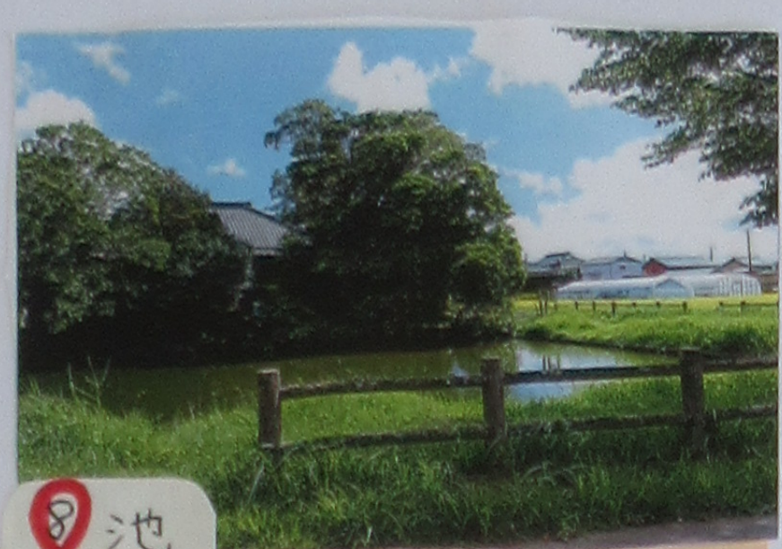
⑧ 池 川のちかくでさく がすくはいからさく