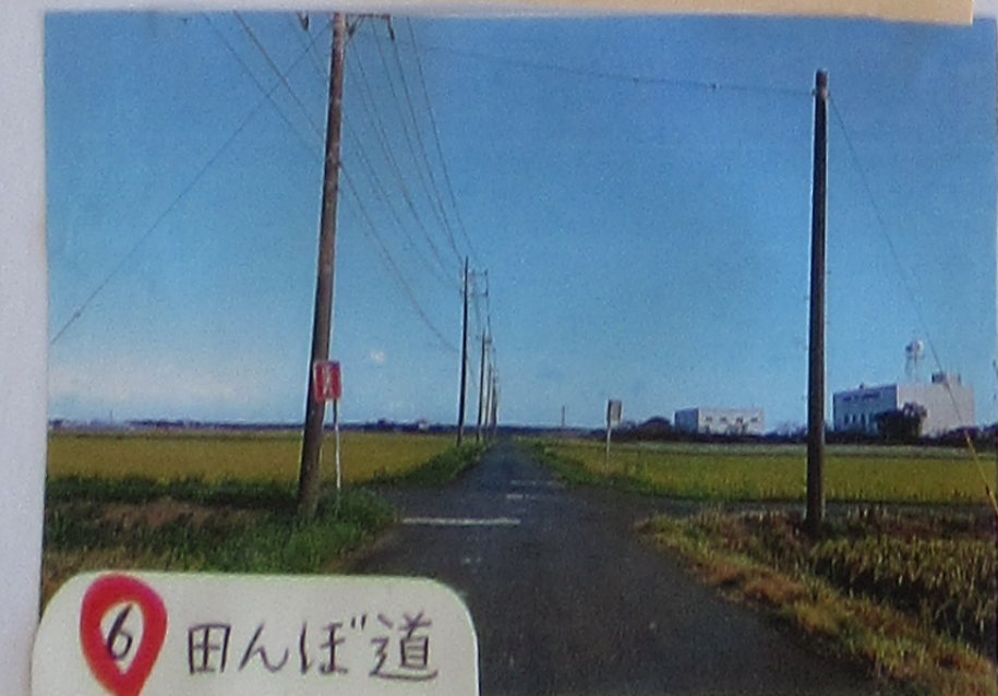
⑥ 田んぼ道 さくが すくはいからさく