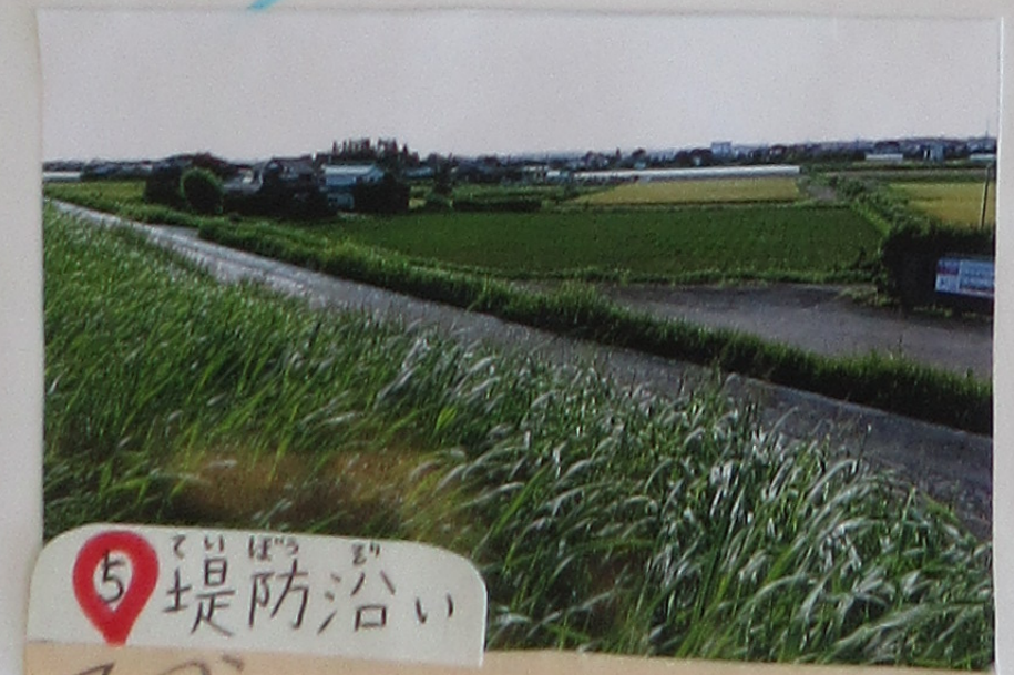
⑤ 堤防沿い さくが すくはいからさく