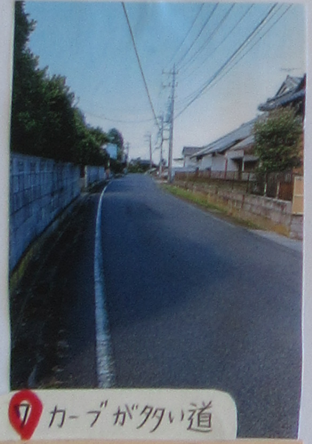
⑦ カーブが多い道 さくが すくはいからさく