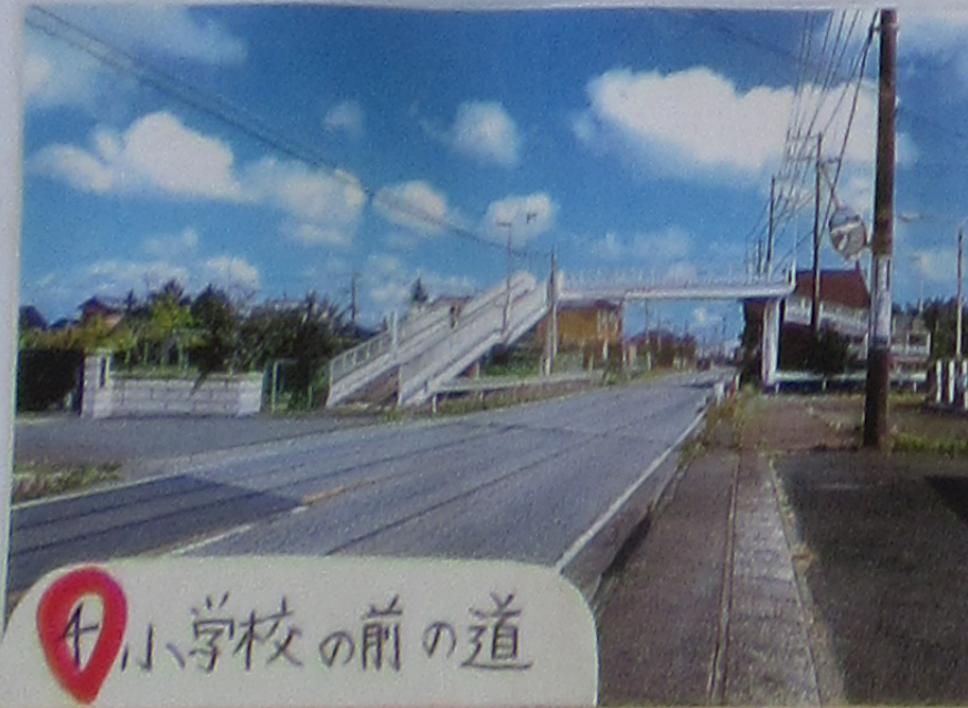
④ 小学校の前の道 さくが すくはいからさく

近所の方へ インタビュー ・近くに交番か あるからこの辺り は安全だよ。 (川・池・水路が多いから) ・水の事故には注意してね。