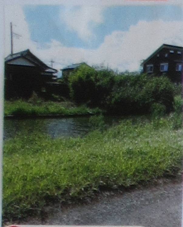
⑤ 川(学校の反対岸) 川のちかくでさく がすくはいからさく