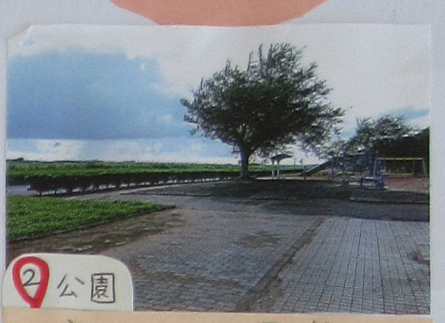
② 公園 おとよがこどもに ちかくでさく すくはいからさく