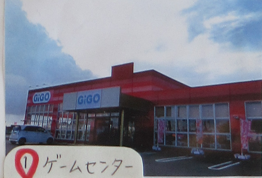
① ゲームセンター 人が すくはいからさく

近所の方へ インタビュー ・近くに交番か あるからこの辺り は安全だよ。 (川・池・水路が多いから) ・水の事故には注意してね。