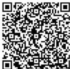
特設サイト二次元コード