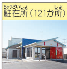
さかわけいさつしよこふるぐちゆうざいしょ (境警察署小福田駐在所)