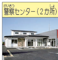
な かみほとけいさつ (那珂湊警察センター)