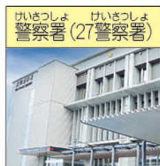
あお た けい さつ しょ (太田警察署)