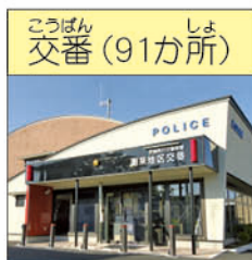
なめがたけいさつしよいほこちこうばん (行方警察署潮来地区交番)