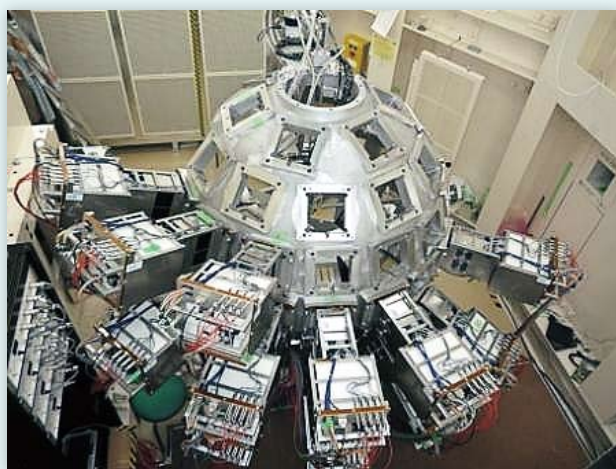
茨城県生命物質構造解析装置

※離転職者に対する職業訓練の効果による就職達成状況を示す指標であり、過去5年間の最高水準を目指します。