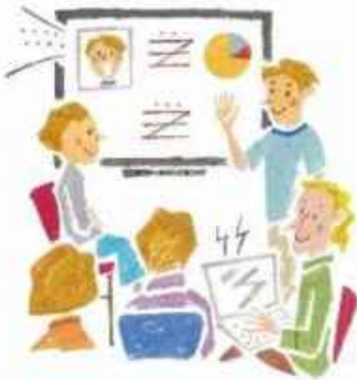
デジタル技術を活用した業務改革