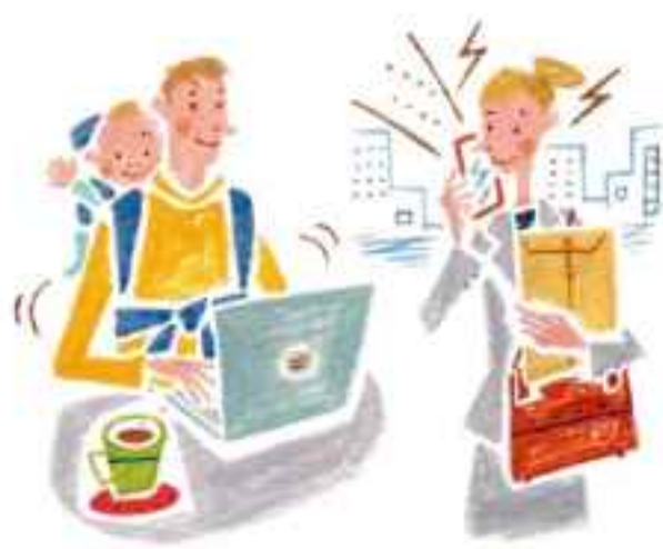
多様で柔軟な働き方の推進