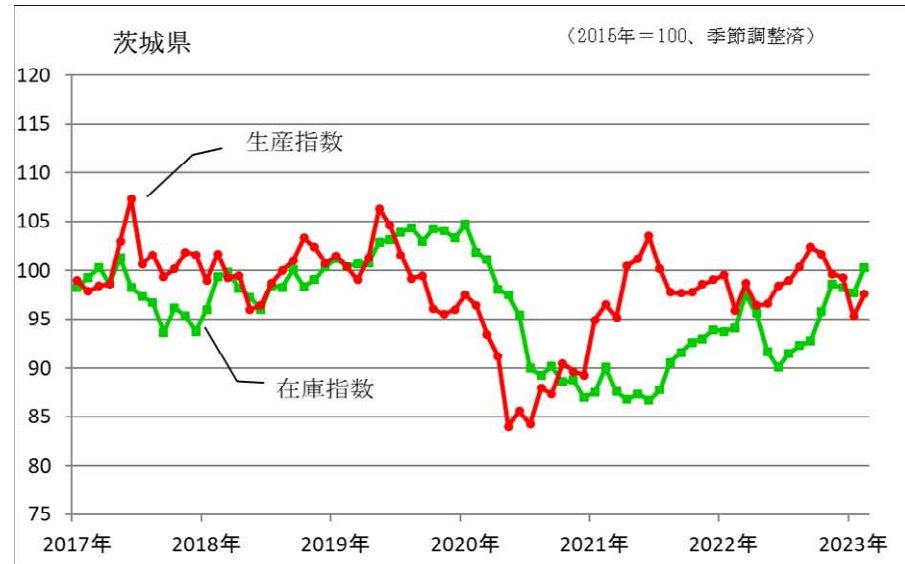
鉱工業生産指数、在庫指数の推移