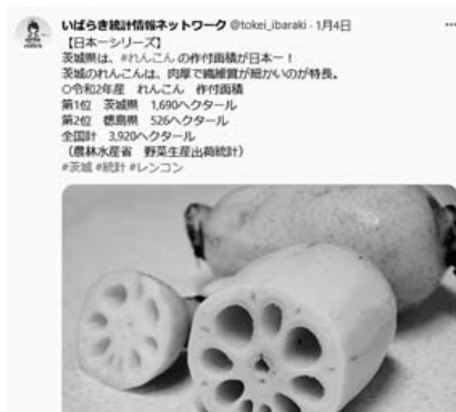
令和4年1月4日れんこん作付面積のTwitter投稿