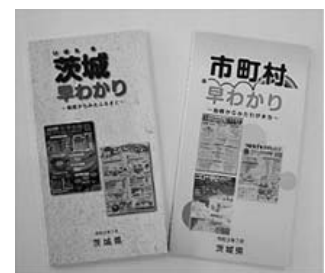
茨城早わかり/市町村早わかり