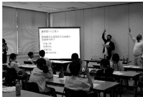
統計出前授業 統計サポーター オスペンギンさんの かすみがうら子ども大学での授業の様子

統計課の職員やいばらき統計サポーターを小学校に派遣して統計の授業を行っています。グラフの見方や茨城の農業・工業などをテーマに、地域に関わる統計データやクイズを用いて楽しく学べるよう工夫しています。受講校を募集しています！