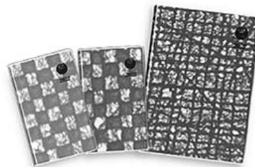
2022年版茨城県民手帳 (限定標準判/限定デスク判)