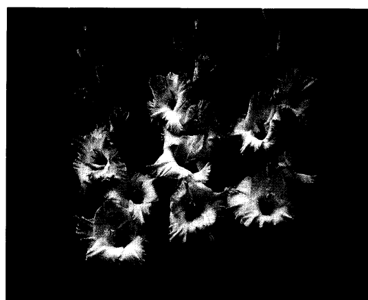
図1 グラジオラス新品種‘舞姫’

グラジオラスは本県の花き栽培の主要な品目で、切り花生産として1998年には作付面積34ha(4)で全国第2位、球根生産では全国生産量の54%(4)のシェアにあたる83ha(4)の栽培面積を誇り全国第1位である。しかし、産地間競争の激化や、球根の輸入自由化等による流通の国際化に対抗していくためにも、産地独自の品種を育成することが営利的に必要となってきた。このため、耐病性・ウイルス抵抗性・早生性を持ち、本県の気象条件や作型に適合し、消費動向にも適合した新品種を育成することを目的に1983年より交雑育種を