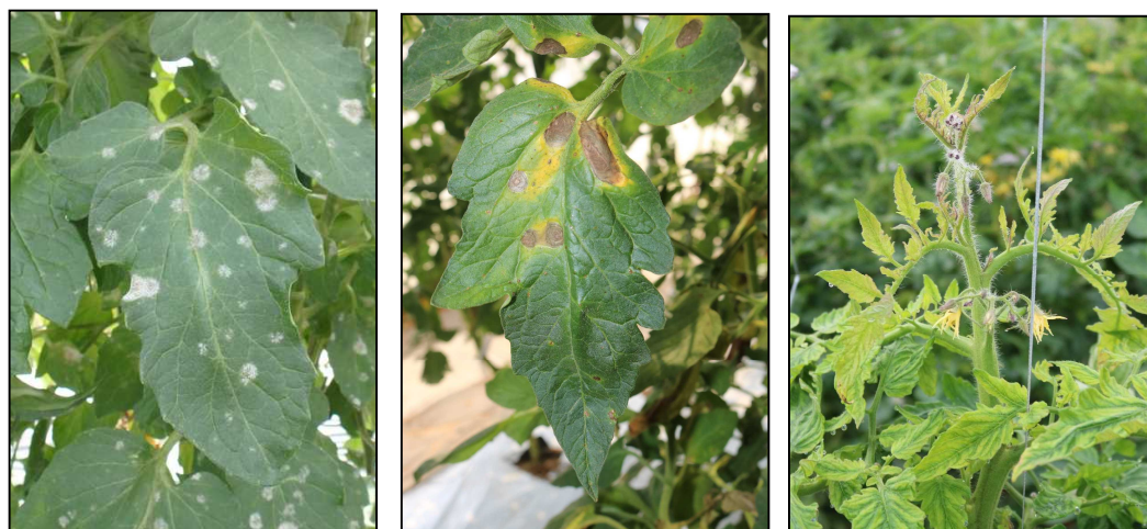
図2 データベース公開画像（トマト）の一例 （左からうどんこ病（葉表）、褐色輪紋病（葉表）、黄化葉巻病（茎頂部））