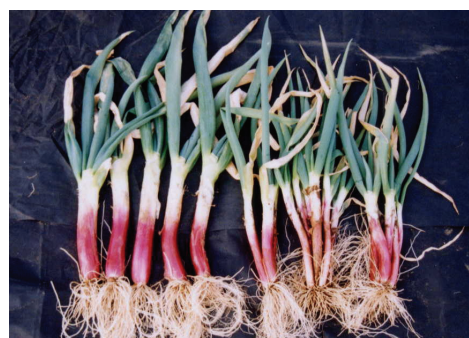
左：園研1号 右：べにぞめ