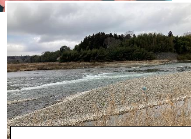
3月15日 那珂川千代橋上流の様子

連絡先 茨城県水産試験場内水面支場 内水面資源部：0299-55-0324（代）