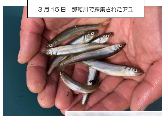
3月15日 那珂川で採集されたアユ