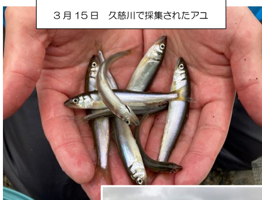
3月15日 久慈川で採集されたアユ