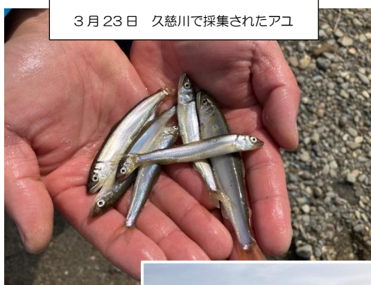
3月23日 久慈川で採集されたアユ