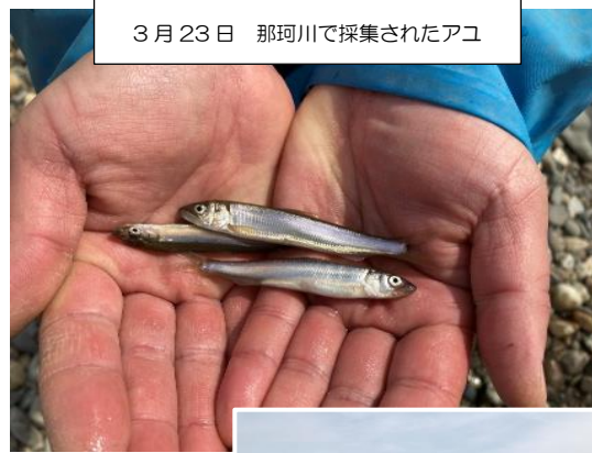
3月23日 那珂川で採集されたアユ