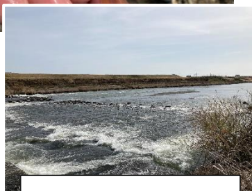
3月23日 久慈川堅磐堰の様子