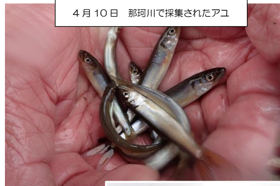
4月10日 那珂川で採集されたアユ