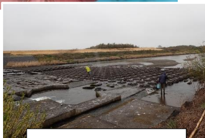
4月10日 久慈川堅磐堰の様子