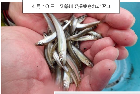
4月10日 久慈川で採集されたアユ