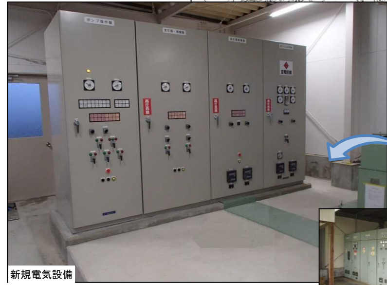
新規電気設備 第9機場 電気設備