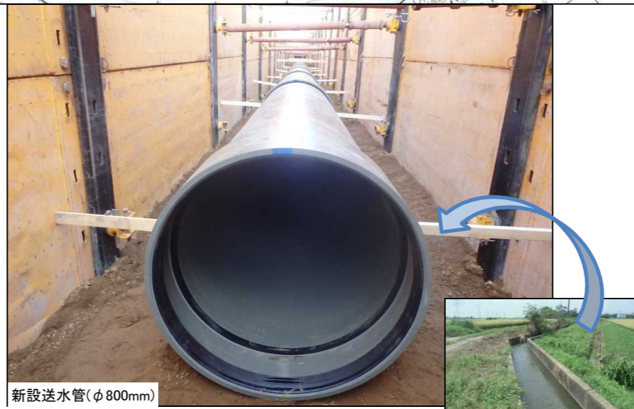
新設送水管(φ800mm) 源清田幹線用水路