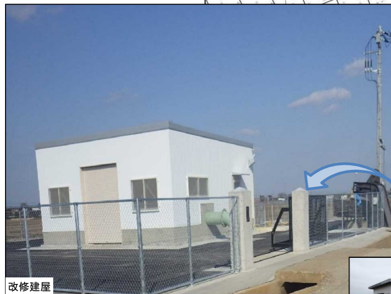
改修建屋 第9機場 建屋