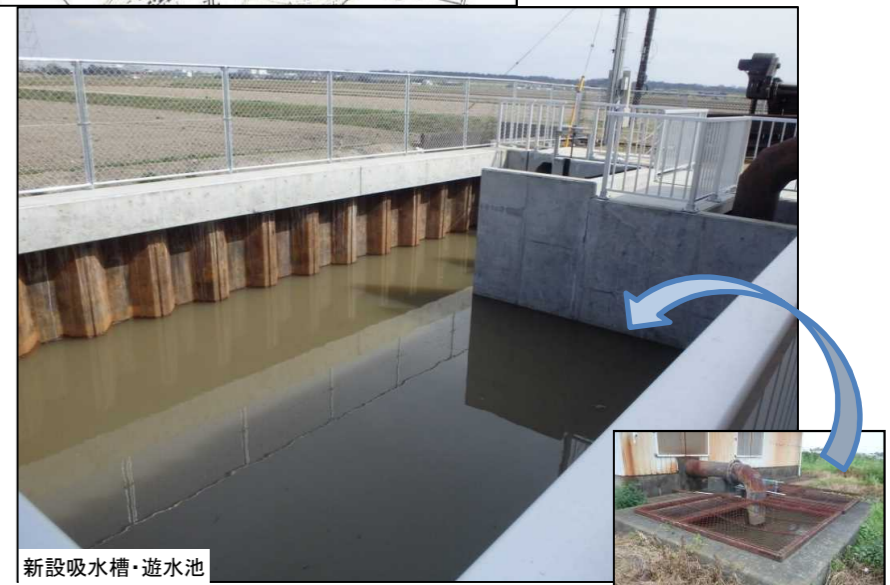
新設吸水槽・遊水池 第9機場 吸水槽