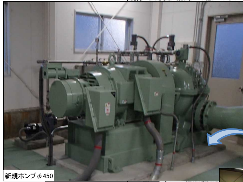
新規ポンプφ450 第9機場 ポンプ