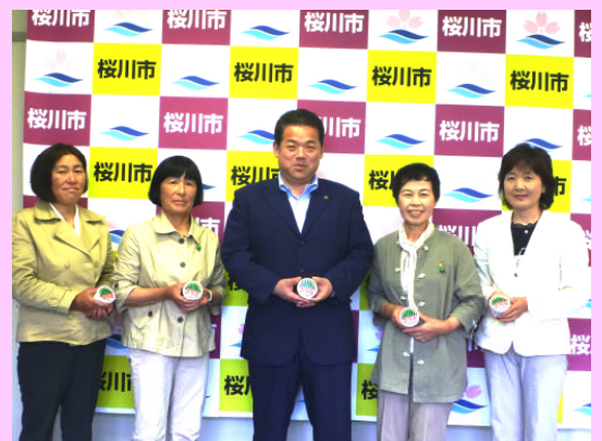
大塚桜川市長とこだまスイカ女性の会メンバー

こだまスイカアイスは、現在「きらいち筑西店」で販売しております。ぜひ一度お召し上がりください!!