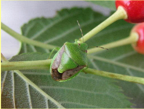
図. チャバネアオカメムシ

県病虫害防除所の調査によると、今年果樹カメムシ類(チャバネアオカメムシ)の越冬量が平年よりやや多く、スギやヒノキの花粉飛散量が平年より少なかったため、カメムシ類の主要な餌であるスギ・ヒノキの球果が不足し、果樹園に飛来する可能性が高いと予想されています。